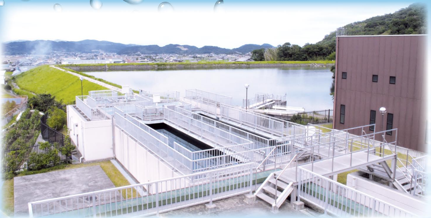
鮎屋浄水場(洲本市鮎屋)